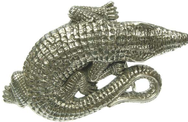
B00304 Buckle Crocodile 680.- Grösse: 110 x 90 mm, massives Sterling Silber ca. 130 Gramm.