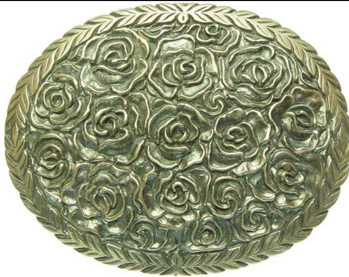
B00301 Buckle Country Rose 470.- Grösse: 90 x 70 mm, massives Sterling Silber ca. 80 Gramm.