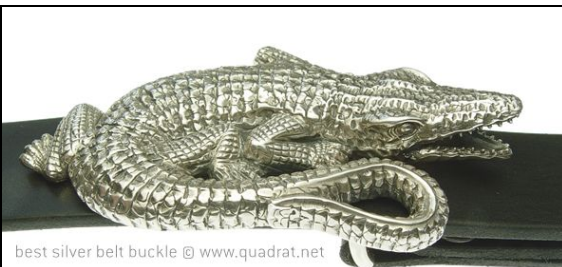
best silver belt buckle @ www.quadrat.net

Unsere Best Silver Belt Buckles sind Gürtelschnallen, welche an jedem Gürtel für auswechselbare Schnallen getragen werden können. Gürtelbreite bis maximal 45 mm. Alle quadrat Buckles sind in massivem Sterling Silber gearbeitet und dadurch schön schwer und massiv.