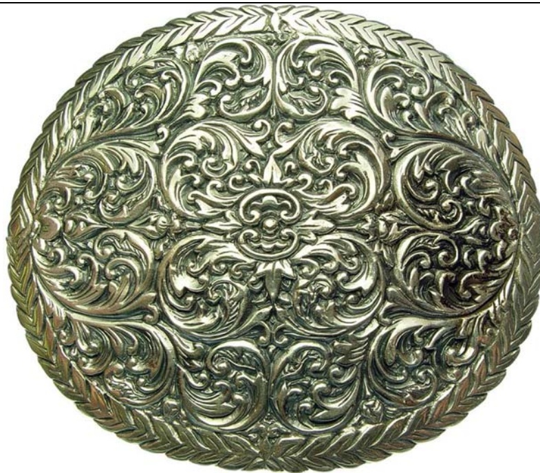
B00305 Buckle Country King 760.- Grösse 110 x 90 mm, massives Sterling Silber ca. 130 Gramm.